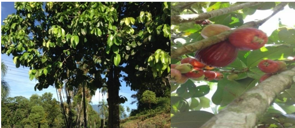
FIGURA 1 – ÁRVORE DO JAMBO VERMELHO E SUA APARÊNCIA EXTERNA

Sua safra não é muito prolongada, sendo que, dura em torno de 3 a 4 semanas após frutificação. Cada árvore produz entre 450 a 1200 frutas, resultando em torno de 20 a 85 kg de frutas por árvore (FALCAO; PARALUPPI; CLEMENT, 2002) (Figura 1). A frutificação ocorre geralmente em períodos mais chuvosos, três meses após a floração, sendo que, a colheita se dá entre os meses de janeiro a maio (CRUZ; KAPLAN, 2004; FARIA; MARQUES; MERCADANTE, 2011).